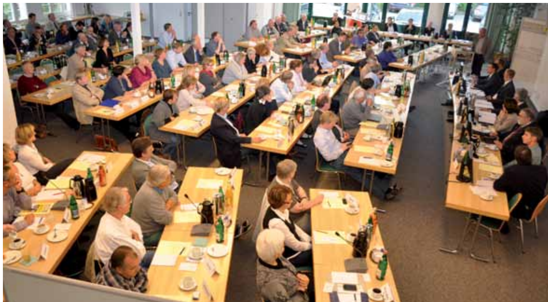
Kammerversammlung im Jahr 2013: Die Abgeordneten hatten zahlreiche Themen zu entscheiden.

Zahlreiche Themen für die alte und neue Kammerversammlung 2013: Startschuss für die Reform der Kammerarbeit, Wahlen und Berufspolitik.