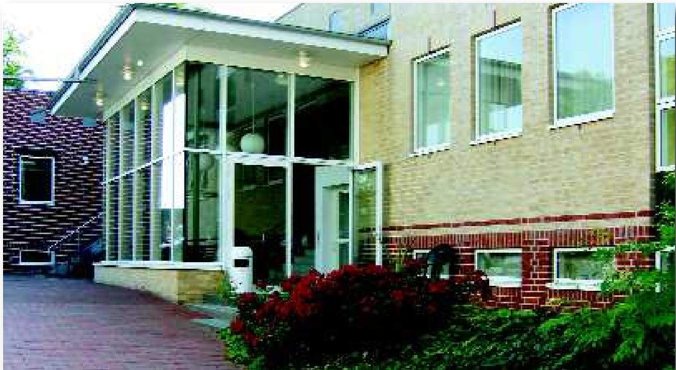
Akademie für medizinische Fort- und Weiterbildung der Ärztekammer Schleswig-Holstein